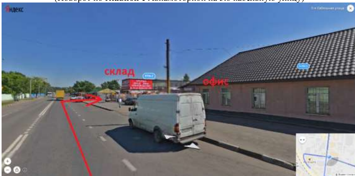
(проезжаете, офис, остановку и сворачиваете на мойку)