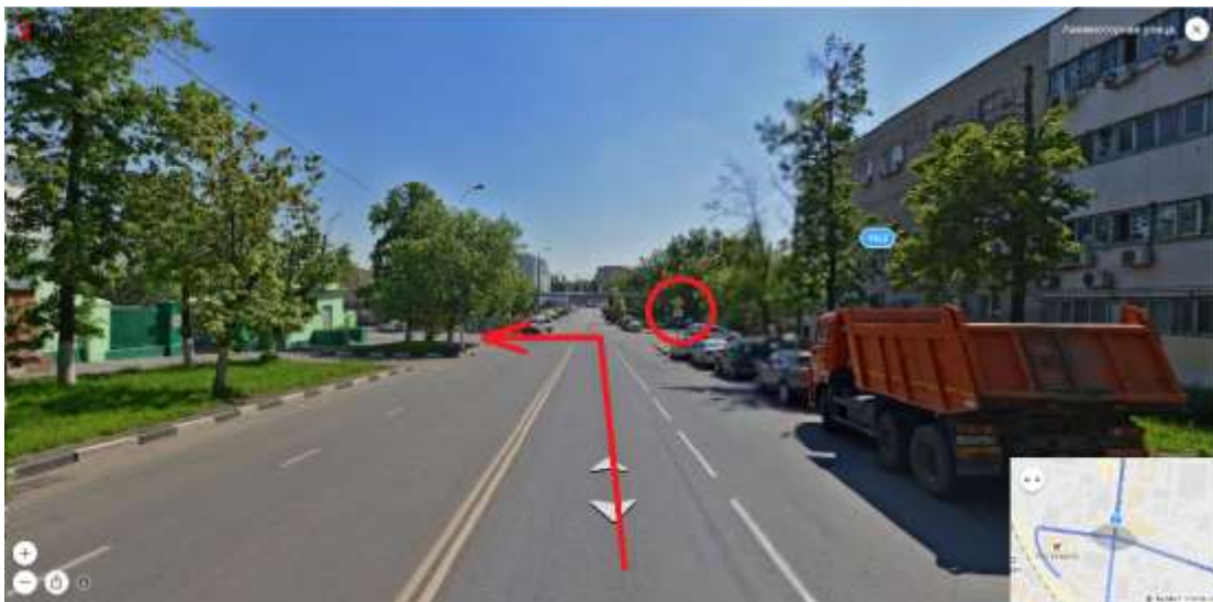
(Поворот по главной с Авиамоторной на 5ю кабельную улицу)